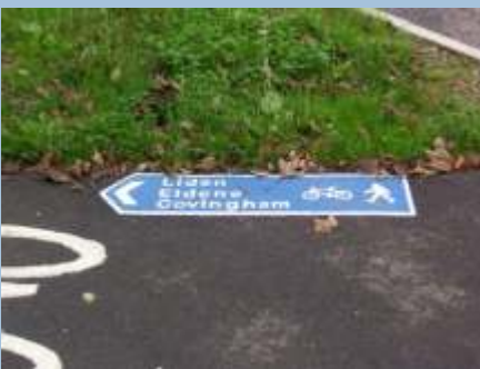
Cykelruteskiltning direkte på asfalten - man må håbe det ikke sneer i England!