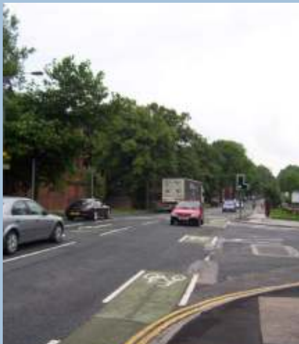
Markering af cykelbaner gennem signalregulerede kryds skal gøre det sikrere at være cyklist i England.