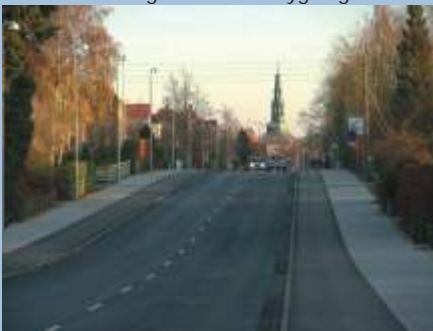
Frederiksværksgade - efter ombygning

For en del af stiruterne er der ligledes udarbejdet en pjece med beskrivelse samt kort over ruten. Målet er, at alle ruter på sigt skal beskrives og pjecen for Rute 103 "Ullerødtruten" er netop blevet udgivet.