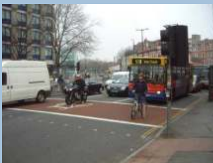
Tilbagtrukne stopstreger med cyklist-lommer anbefales i England