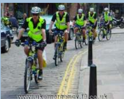
Cykelpoliti på gaderne øger cyklisternes image.