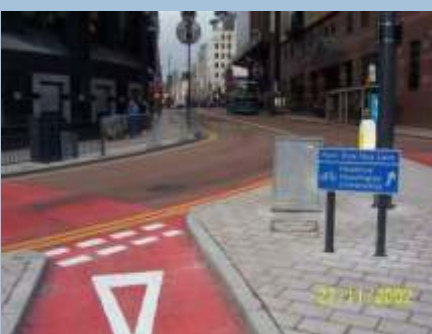
God skiltning skal gøre det nemmere at være cyklist i England