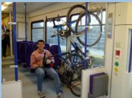
Pladsbesparende cykelmedtagning på The Riverline Light Rail i New Jersey - USA