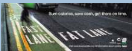
Cykelkampagne med et meget klart budskab rettet mod pendlere i Manchester - England.