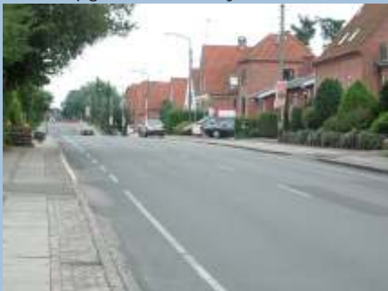
Frederiksværksgade - før ombygning

Målet er imidlertid på sigt, at sikre de bedst tænkelige fysiske vilkår for cyklisterne på alle ruterne og senest er en central vejstrækning gennem Hillerød blevet opgraderet med cykelstier.