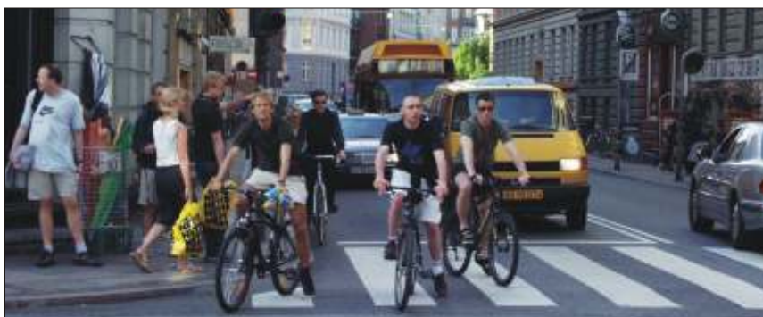
Nyt forsøg med cykelstier langs Enghavevej

Hele cykelstinetet får et løft med nye cykelstier og cykelbaner på strækninger, som længe har været ønsket af cyklisterne. Det betyder, at der nu kommer cykelstier/baner på Nørre Voldgade, Øresundsvej, Carl Jacobsens Vej, Hillerødgade, Niels Juels Gade, Lille Kongensgade, og så bliver der lavet forsøg på Enghavevej og Kingsgade.