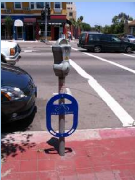
I San Diego (Californien) udnyttes parkometerstanderen også til cykelparkering - dog er det kun bilerne, der skal betale for parkeringen.