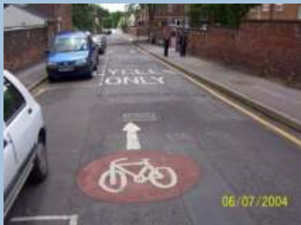
Cykling mod ensretningen på udvalgte gadeforløb skal tilgodese cyklisternes fremkommelighed.