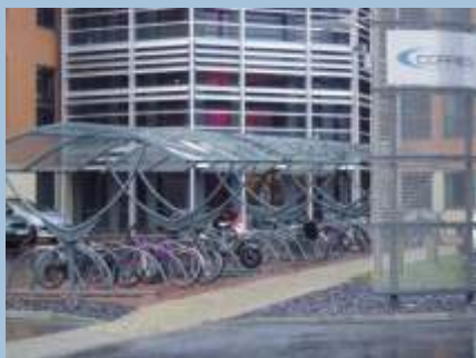
Gode cykelparkeringsforhold bliver etableret for at fremme cyklismen i bl.a. Aylesbury.