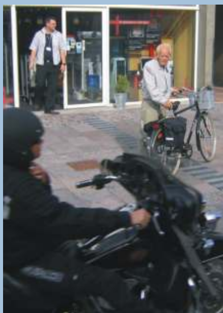
Cykling er et spørgsmål om livsstil

Fredericia Kommune har i en årrække gjort en stor indsats for at udbygge faciliteterne for cykeltrafikken og for at forbedre trafikikkerheden, men betingelserne for fortsatte forbedringer og fastholdelse af den gunstige udvikling er, at der foretages en langsigtet og koordineret indsats på cyklistområdet og med