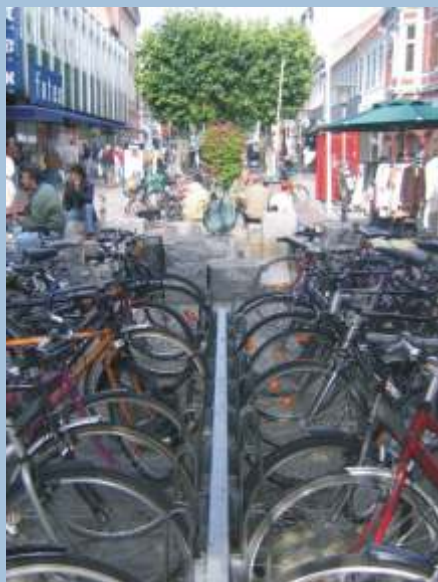
Gode cykelparkerings forhold er et vigtigt element i cykelhandlingsplanen for Fredericia

Fredericia Kommune har lavet en cykelhandlingsplan. Listen over påtænkte projekter indeholder bl.a. millionprojekter som f.eks. en række nye cykelstier, projekter om bedre afmærkning, flere chikaner og elektroniske trafiktavler.